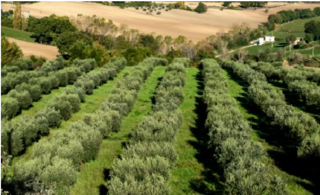
Panoramablick über die eigenen Felder