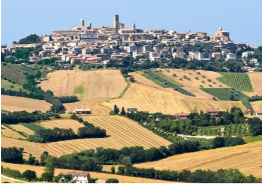
Aussicht auf Montelupone